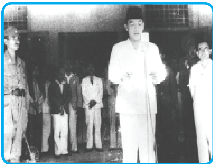
Sumber: Buku 30 Tahun Indonesia Merdeka Gambar 3.4 Proklamasi Kemerdekaan tanggal 17 Agustus 1945 merupakan tanda berakhirnya hukum kolonial diganti dengan hukum nasional

Sebagai suatu negara yang merdeka, Negara Kesatuan Republik Indonesia mempunyai tata hukum sendiri. Tata hukum suatu negara mencerminkan kondisi objektif dari negara yang bersangkutan sehingga tata hukum suatu negara berbeda dengan negara lainnya. Tata hukum negara kita berbeda dengan tata hukum negara lainnya.